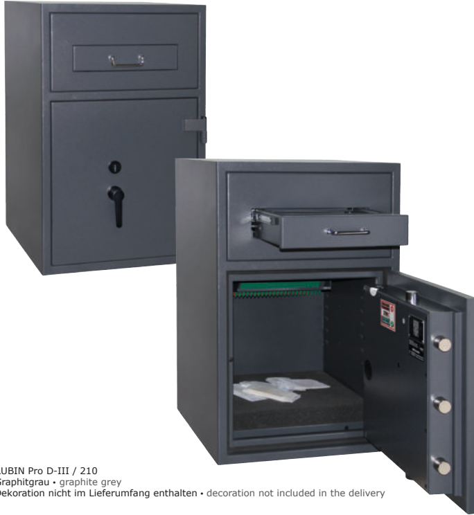
RUBIN Pro D-III / 210 Graphitgrau • graphite grey Dekoration nicht im Lieferumfang enthalten • decoration not included in the delivery

🇩🇪 Zertifizierter Depositschrank gem. Widerstandsgrad D-III nach EN 1143-2 für den Einsatz im gewerblichen Bereich. Verschiedene Modellvarianten je nach individuellen Nutzungsbedingungen und räumlichen Gegebenheiten verfügbar.