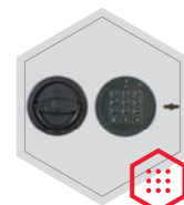
Elektronischschloss kombiniert mit mechanischer Revision (Ausser Art. 33200-33201)