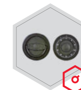
Mechanisches Kombinationsschloss (Ausser Art. 33200- 33201)