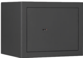
M 310 Graphitgrau • graphite grey