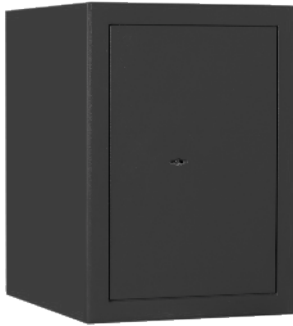
M 210 Graphitgrau • graphite grey