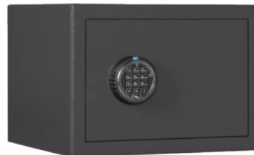
M 410 Elo Graphitgrau • graphite grey

Dekoration nicht im Lieferumfang enthalten • decoration not included in the delivery