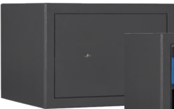
M 410 Graphitgrau • graphite grey