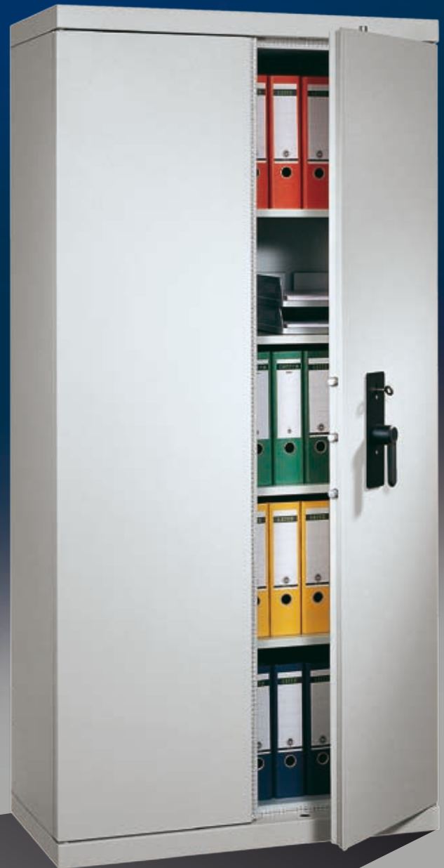
Abb.: BK 22