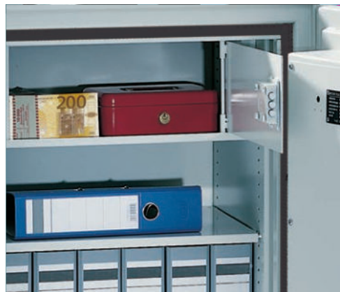
Separat verschließbares Innenfach