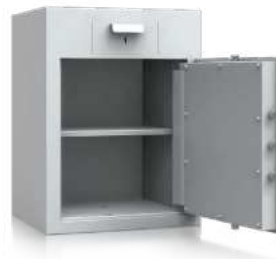
GT EW mit Einwurf-schublade