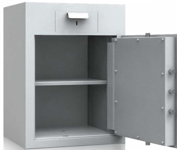
Modell GT EW