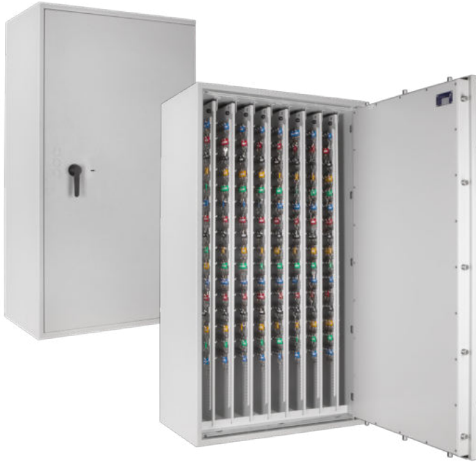
STL 2560 Lichtgrau • light grey Dekoration nicht im Lieferumfang enthalten • decoration not included in the delivery

Schlüsseltresor und Wertschutzschrank, Grad 0 (EN 1143-1) oder Grad I (EN 1143-1) Key safe and security safe, Grade 0 (EN 1143-1) or Grade I (EN 1143-1)