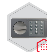
Elektronisches Kombinationsschloss (Ausser Art. 33000-33001)