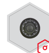
Mechanisches Kombinationsschloss (Ausser Art. 33000)

Optionale Verschlussvarianten gegen Mehrpreis