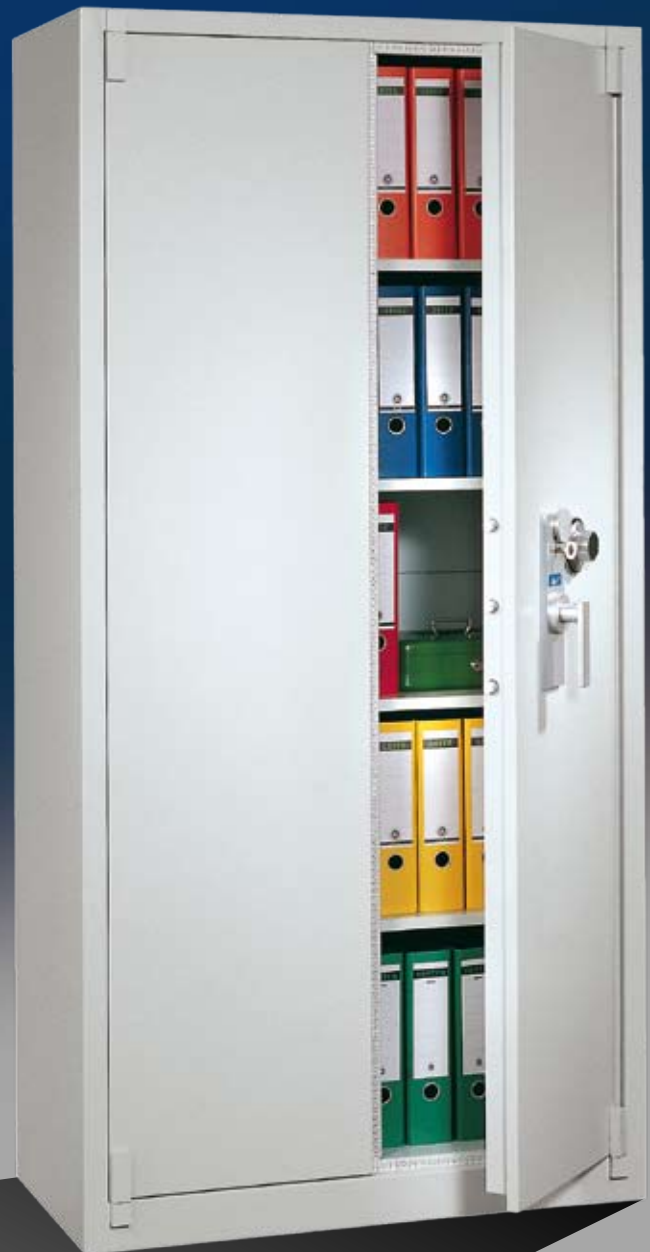
Abb.: BS 1100 (mit Sonderausstattung zusätzlichem ZKS)

Tür dreiwandig; Stahlschrank über alle Kanten gebogen und sorgfältig verschweißt