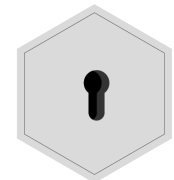
Vorrichtung für Profilhalbzylinder-Schloss