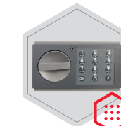
Elektronisches Kombinationsschloss (außer Art. 17000-17001)

Optionale Verschlussvarianten gegen Mehrpreis