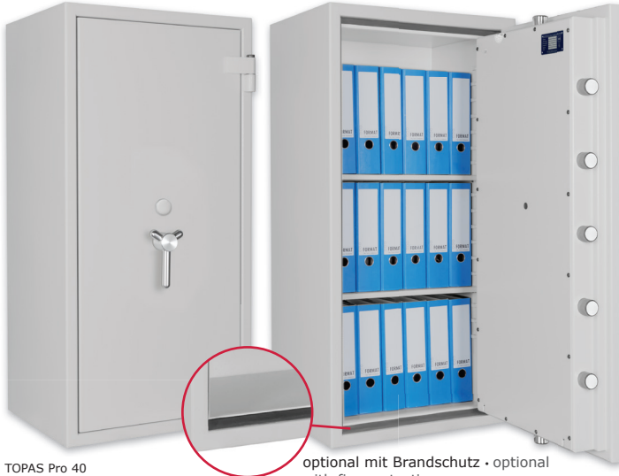
TOPAS Pro 40 Lichtgrau • light grey

optional mit Brandschutz • optional with fire protection