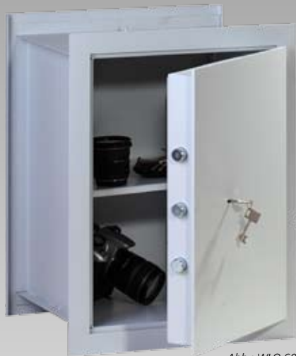
Abb.: WLO 60