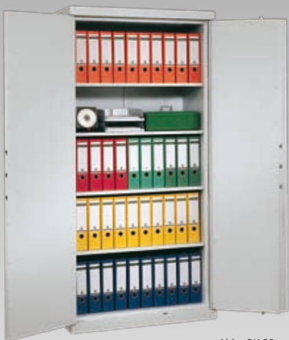
Abb.: BK 22