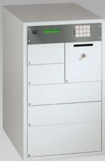
Abb.: MC 83-6-FAAC

MCA 68 – 6 – ABHH – r Gehäuse – Anzahl der Schublade – Schublade-Modul – Ergänzendes Ausstattungsmodul