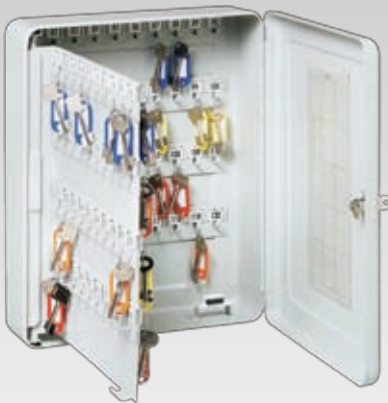
Abb.: RL 120