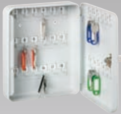
Abb.: RL 30