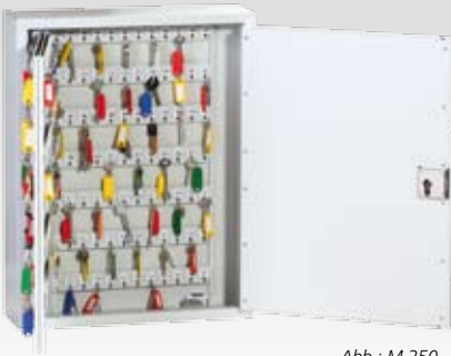
Abb.: M 250 mit Vorrichtung für Profilhalbzylinder