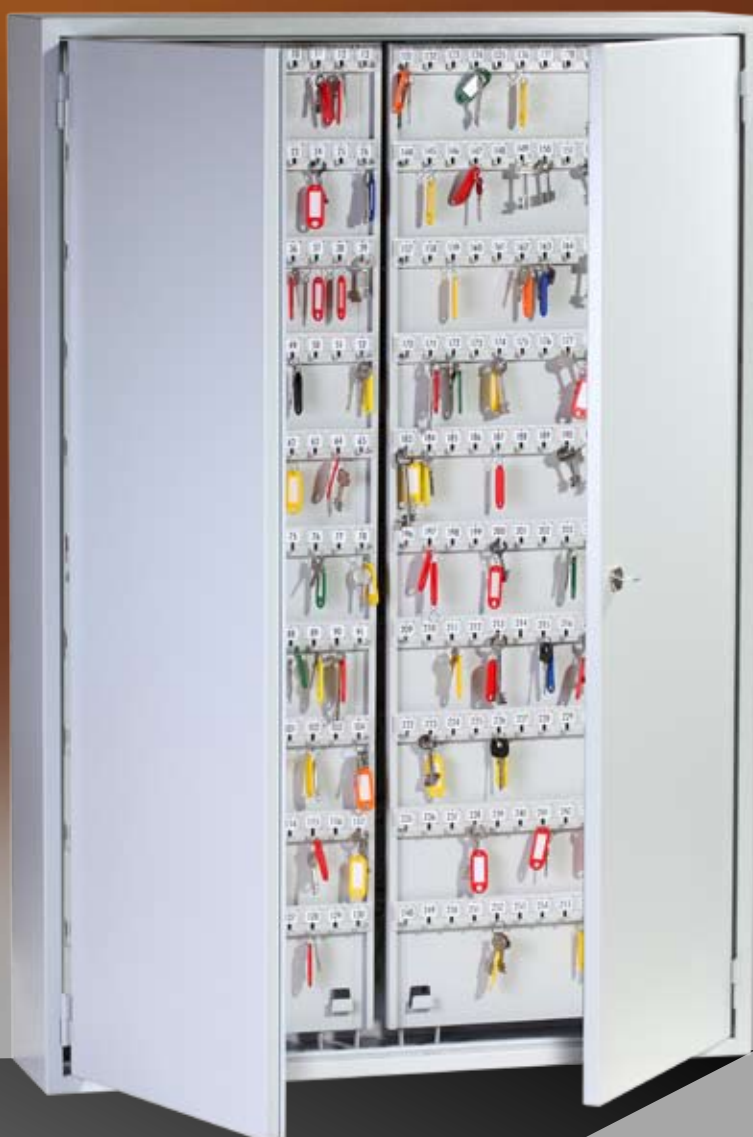
Abb.: GG 780

Schlüsselleiste verstellbar, mit stabilen Metallhaken