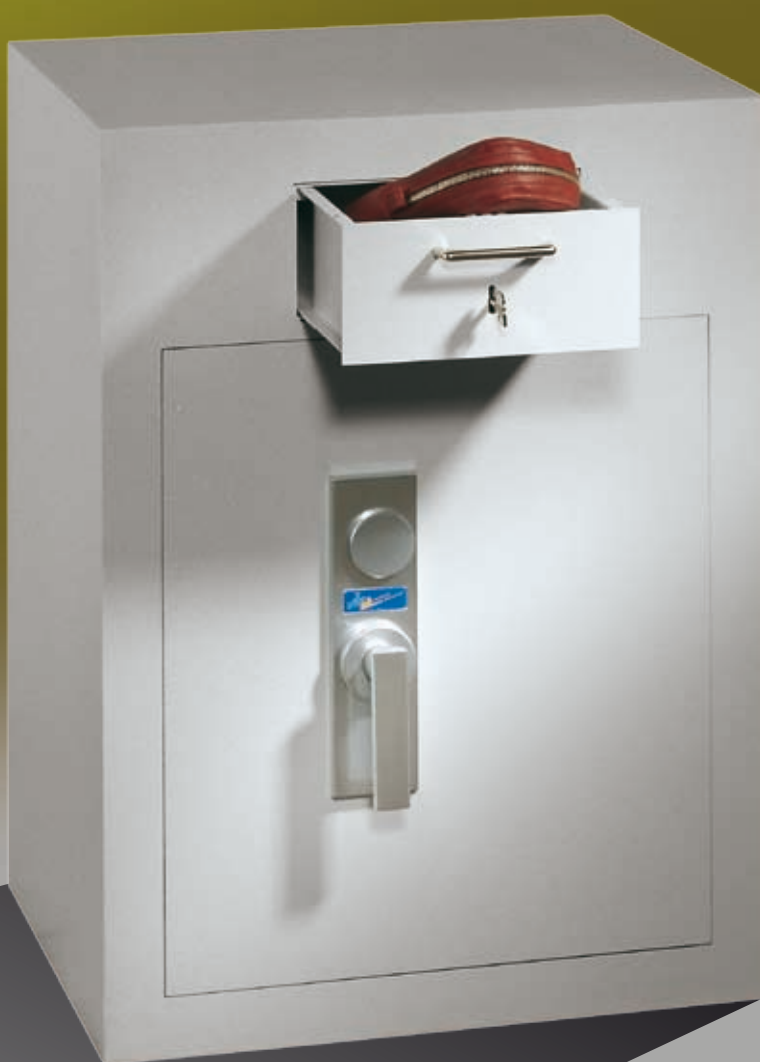
Abb.: GT EW