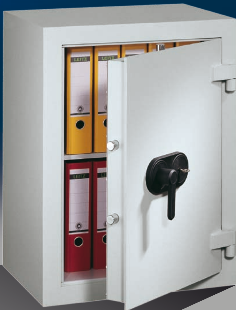
Abb.: EV 0-80