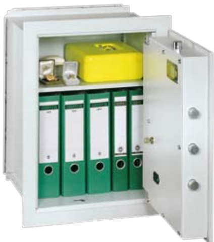
Abb.: VCO 6