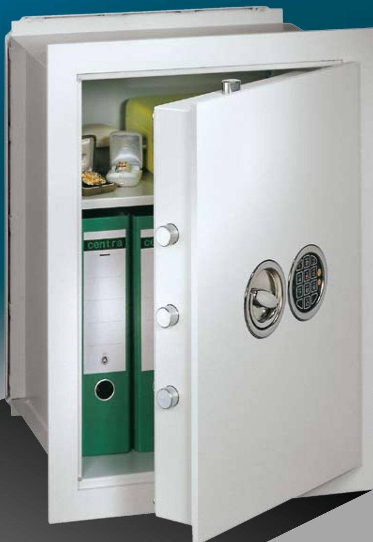
Abb.: VCO 6 (mit Sonderausstattung EZ LG Basic versenkt)