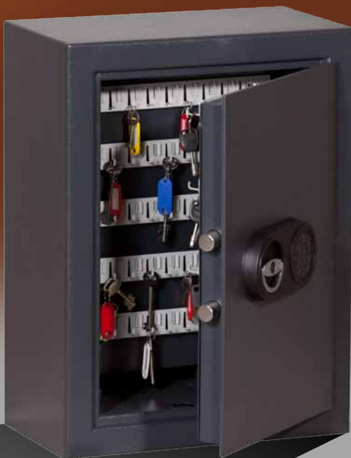
Abb.: STZ 100 mit Sonderausstattung EZ