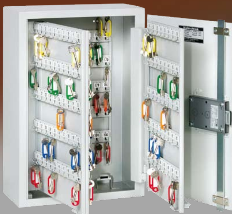
Abb.: ST 200

Hochwertiges Stahlblech Schlüsselleiste verstellbar, mit stabilen Metallhaken