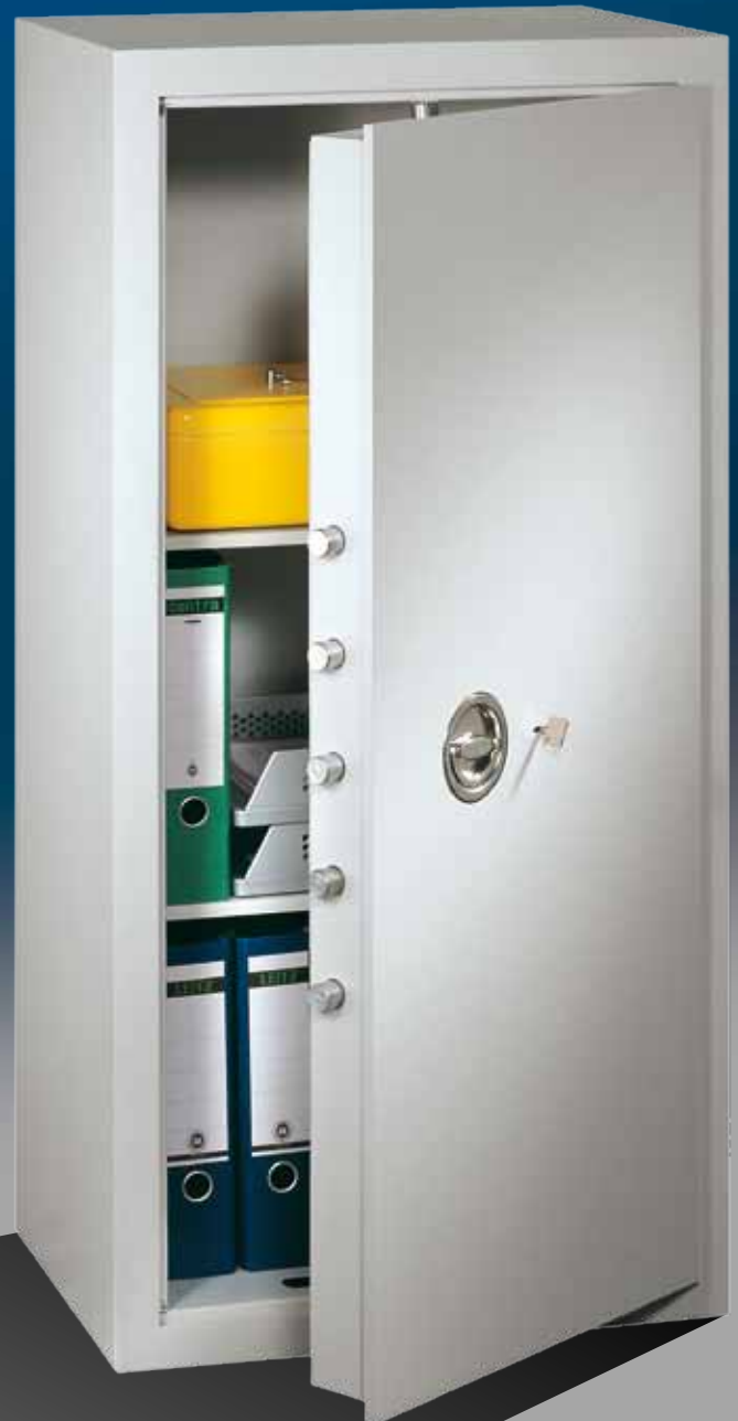
Abb.: MVO 12