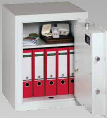
Abb.: MVO 6