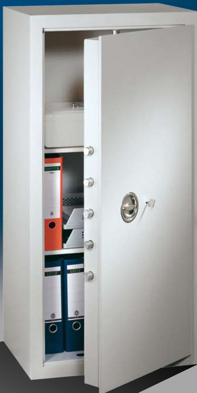
Abb.: MNO 12