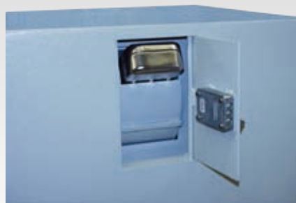
Abb.: GT EW mit Trommeleinwurf