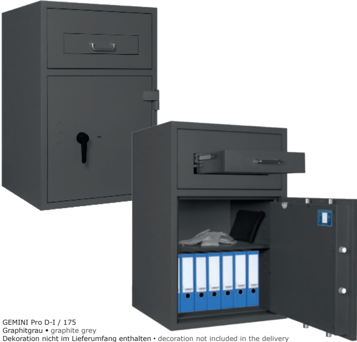
GEMINI Pro D-I / 175 Graphitgrau • graphite grey Dekoration nicht im Lieferumfang enthalten • decoration not included in the delivery