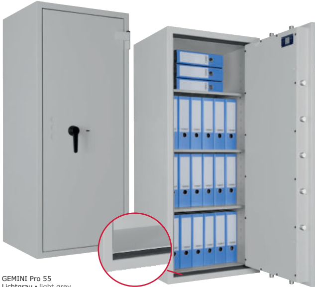
GEMINI Pro 55 Lichtgrau • light grey Dekoration nicht im Lieferumfang enthalten • decoration not included in the delivery

Wertschutzschrank, Grad I (EN 1143-1) Safe, Grade I (EN 1143-1)