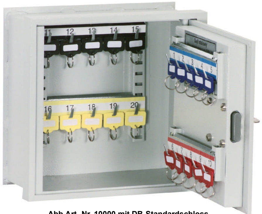
Abb.Art.-Nr. 10000 mit DB-Standardschloss (Lieferung ohne Schlüsselanhänger)

Lackierung: RAL 7035 lichtgrau Achtung: Tresore kopflastig - bei Inbetriebnahme entsprechende Sorgfalt gem. Einbauanleitung walten lassen!