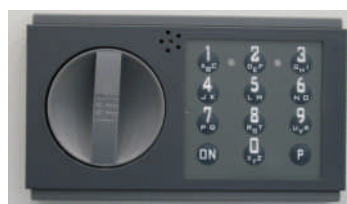
Art.-Nr. 10022 15mm vorstehend