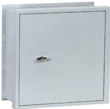
Art.-Nr. 10000 mit DB-Standardschloss flächenbündig

Hakenleisten im Raster von 14mm höhenverstellbar