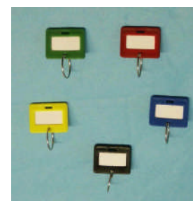
Art.-Nr. 10023 Schlüsselanhänger gg. Mehrpreis

Sondermaße und Ausführungen gg. Mehrpreis lieferbar!