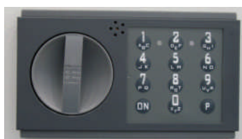
Art.-Nr. 10022 15mm vorstehend