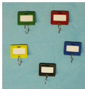
Art.-Nr. 12027 Schlüsselanhänger gg. Mehrpreis