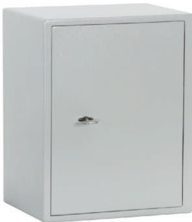
Art.-Nr. 12001 mit DB-Schloss (flächenbündig) - Standard