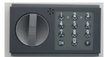
Art. Nr.: 12022 15mm vorstehend

Sondermaße und Ausführungen gg. Mehrpreis lieferbar !