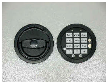
Art.-Nr. 11022, 12 mm vorstehend, gg. Mehrpreis