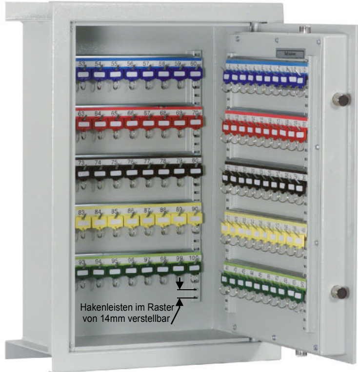
Art.-Nr.11001 (Lieferung erfolgt ohne Schlüsselanhänger)

Achtung: Tresore kopflastig - bei Inbetriebnahme entsprechende Sorgfalt gem. Einbauanleitung walten lassen!