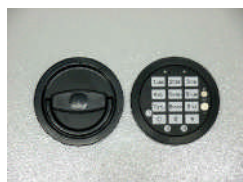
DFS Schloss Art. Nr.: 59321 Art. Nr.: 59322 Art. Nr.: 59323