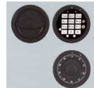
DFS Schloss mit mech. Revision Art.Nr. 59328

Bis 40 Kurzwaffen (bei Einsatz von zusätzlichen 8 Waffenhaltern im Innentresor gg. Mehrpreis) und Munition ohne räumliche Trennung (Schrank muss verankert werden!).