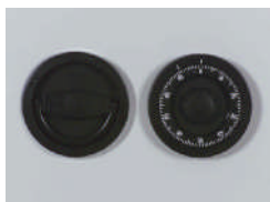
Mechanisches ZK Schloss Art. Nr.: 59320