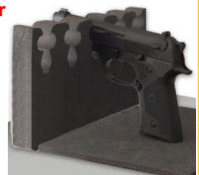
Waffenhalter auf Fachboden

* zusätzliche Waffenhalter für Fachboden sind lose beigelegt und können nach Bedarf mittels doppel-seitigem Kleband vom Kunde selbst auf Fachboden eingeklebt werden.