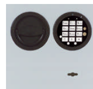
DFS Schloss mit mech. Revision Art. Nr. 59327