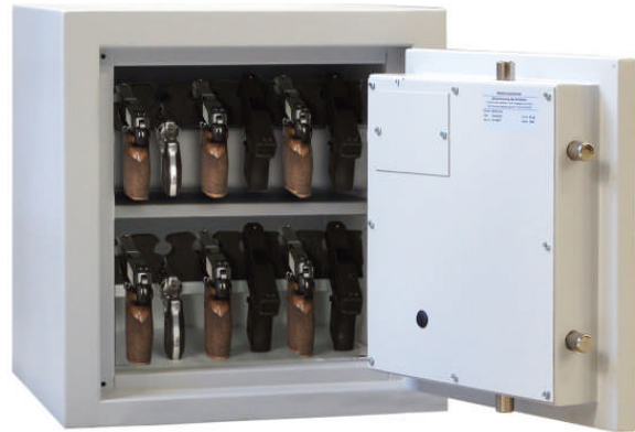
Art. Nr. 59301 Tresorboden und verstellbarer Waffenhalter mit je 6 Waffenhalter (siehe auch Ausklinker).

Versicherungsschutz durch definierte Einbruchprüfung nach PN-EN 1143-1 Klasse I priv. bis € 65.000,- gewerblich bis € 20.000,- bei fach- u. sachgemäßer Verankerung gem. beigefügter Anleitung (Unverbindliche Richtwerte, sprechen Sie mit Ihrer Versicherung.) Der Einbau von EMA-Komponenten (doppelte Versicherungssumme) ist gg. Aufpreis möglich Allseitig mehrwandiger Korpus mit mehrwandiger Tür. Die Konstruktion garantiert einen definierten Einbruchschutz gegen Angriffe mit mechanischen und thermisch wirkenden Einbruchwerkzeugen. (Einbruchschutz 30/50 RU). Serienmäßig 1 Bohrung im Boden für Verankerung. Die Verriegelung erfolgt über DB-Schloss der Schloss-Klasse. I. (inkl. zwei Schlüssel). 3-seitige Verriegelung über Klappgriff 12 mm vorstehend. Tür mit Hintergreifprofil. Waffenhalter aus Schaumstoff auf Boden und Fachboden. Standardlackierung: RAL 7035 lichtgrau bzw. RAL 6020 chromoxidgrün (bitte bei der Bestellung angeben!) Sonderlackierung gegen Aufpreis möglich! Modelle 59302 und 59303 serienmäßig mit Innentresor mit Zylinderschloss.