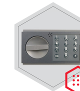
Elektronisches Kombinationsschloss (außer Art. 17000-17001)