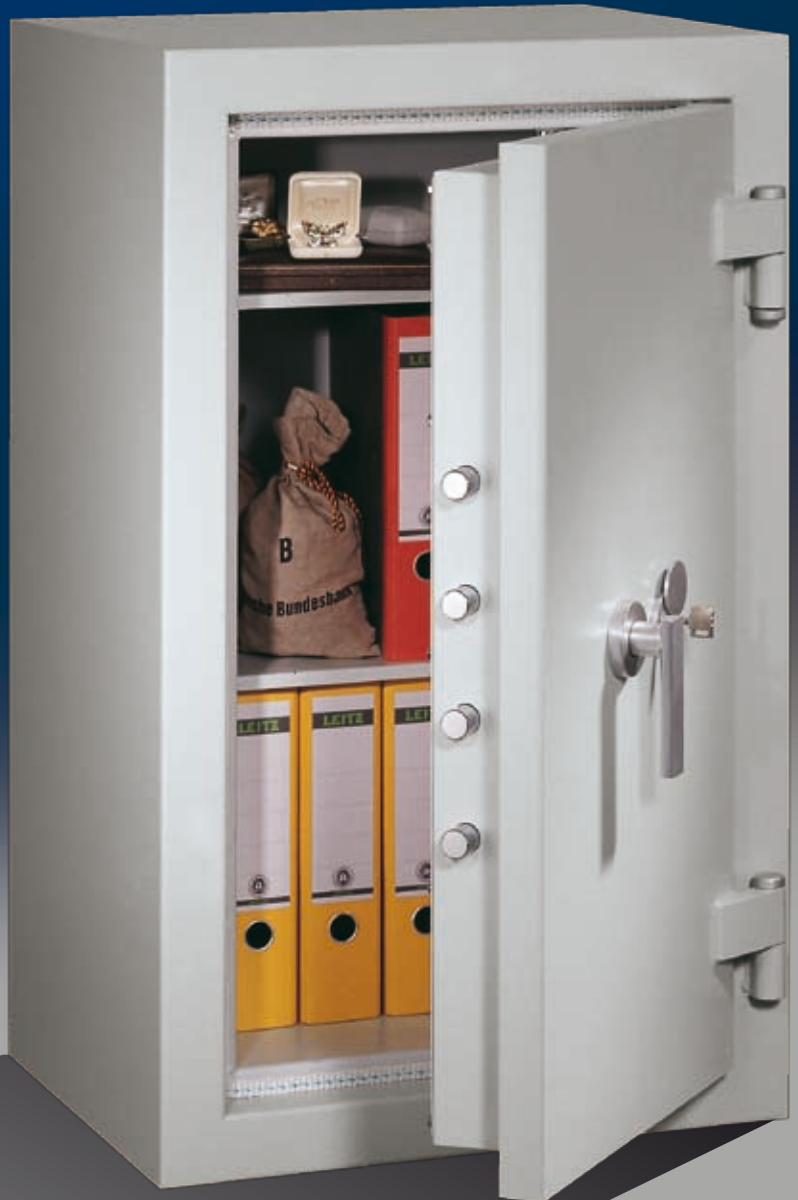
Abb.: EN 0-100