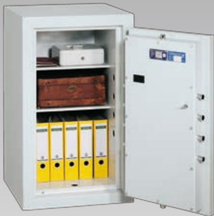
Abb.: EN 0-100