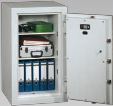
Abb.: EN 1-100