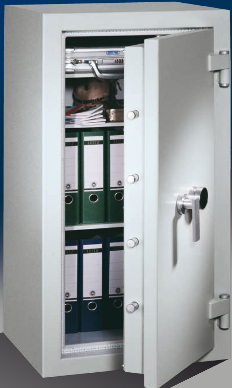
Abb.: EN 1-120 (mit Sonderausstattung ZKS)