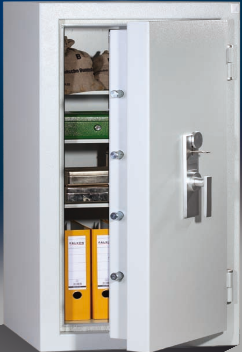
Abb.: EN 3-120