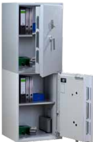
Abb.: EW 3T-163

Auf Anfrage: Zertifizierte Ausführung mit zwei Türen übereinander (Muster siehe unten)