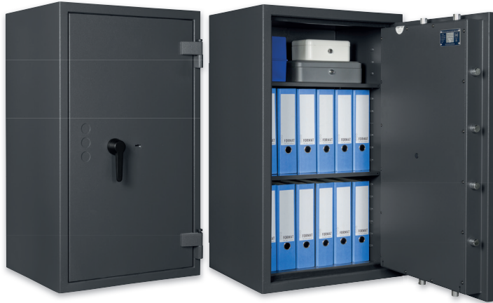
LIBRA 40 Graphitgrau • graphite grey Dekoration nicht im Lieferumfang enthalten • decoration not included in the delivery

Wertschutzschrank, Grad N/0 (EN 1143-1) Safe, Grade N/0 (EN 1143-1)