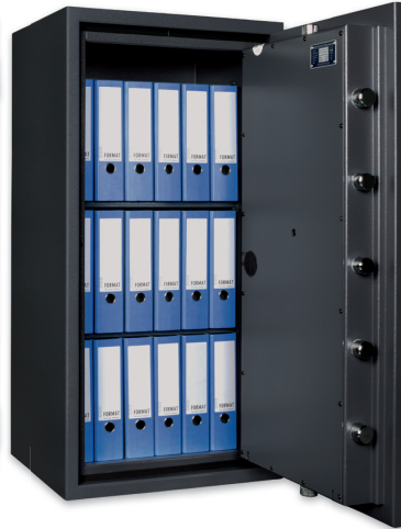
RUBIN Pro 40 Graphitgrau - graphite grey Dekoration nicht im Lieferumfang enthalten • decoration not included in the delivery

🇩🇪 Zertifizierter Wertschutzschrank gem. Widerstandsgrad III nach EN 1143-1. Freistehend einsetzbare Tresorerie mit vielen Modellvariationen, vielseitigen Zubehöroptionen und serienmäßiger Vorrichtung zum Anschluss an eine Einbruchmeldeanlage. Gewichtsoptimierte Bauweise und große Innenraumvolumen bieten flexible Einsatzmöglichkeiten.