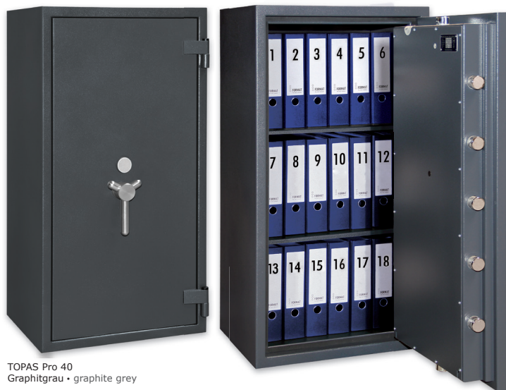
TOPAS Pro 40 Graphitgrau • graphite grey

Wertschutzschrank, Grad II (EN 1143-1) Safe, Grade II (EN 1143-1)