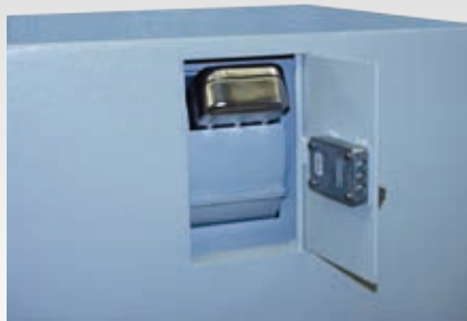
Abb.: GT EW mit Trommeleinwurf