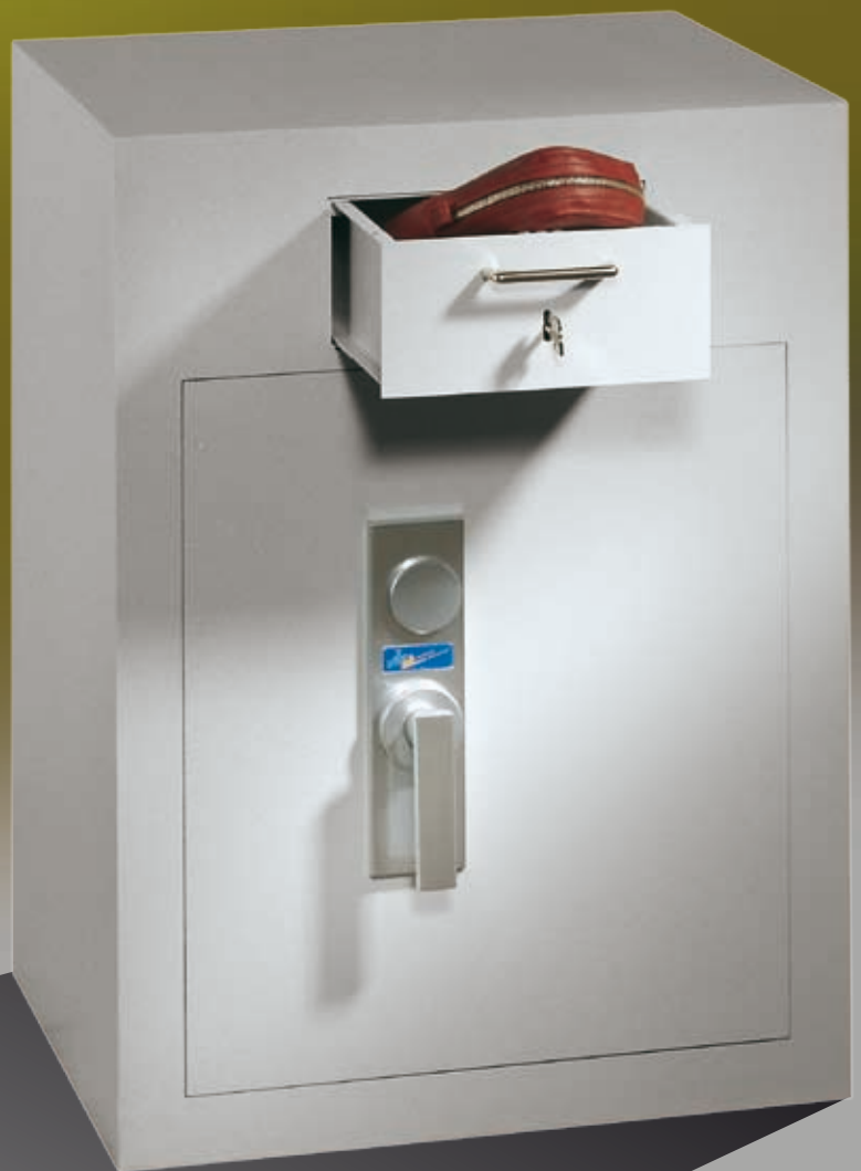
Abb.: GT EW