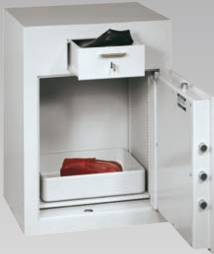
Abb.: GT EW