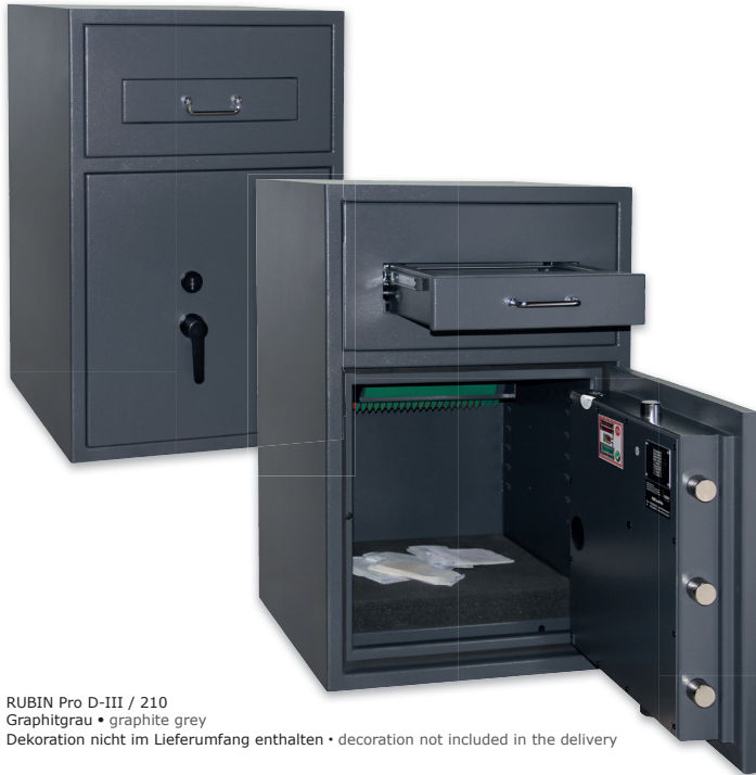
RUBIN Pro D-III / 210 Graphitgrau • graphite grey Dekoration nicht im Lieferumfang enthalten • decoration not included in the delivery

Depositschrank, Grad D-III (EN 1143-2) Deposit safe, Grade D-III (EN 1143-2)