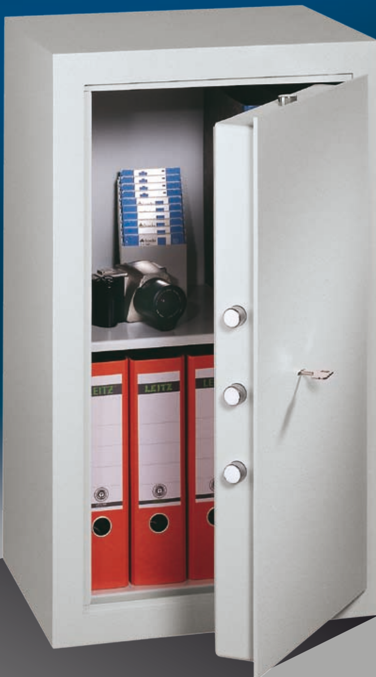
Abb.: MLE 81