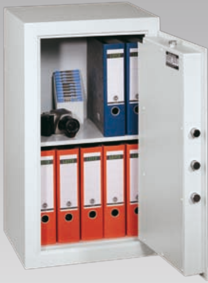
Abb.: MLE 81