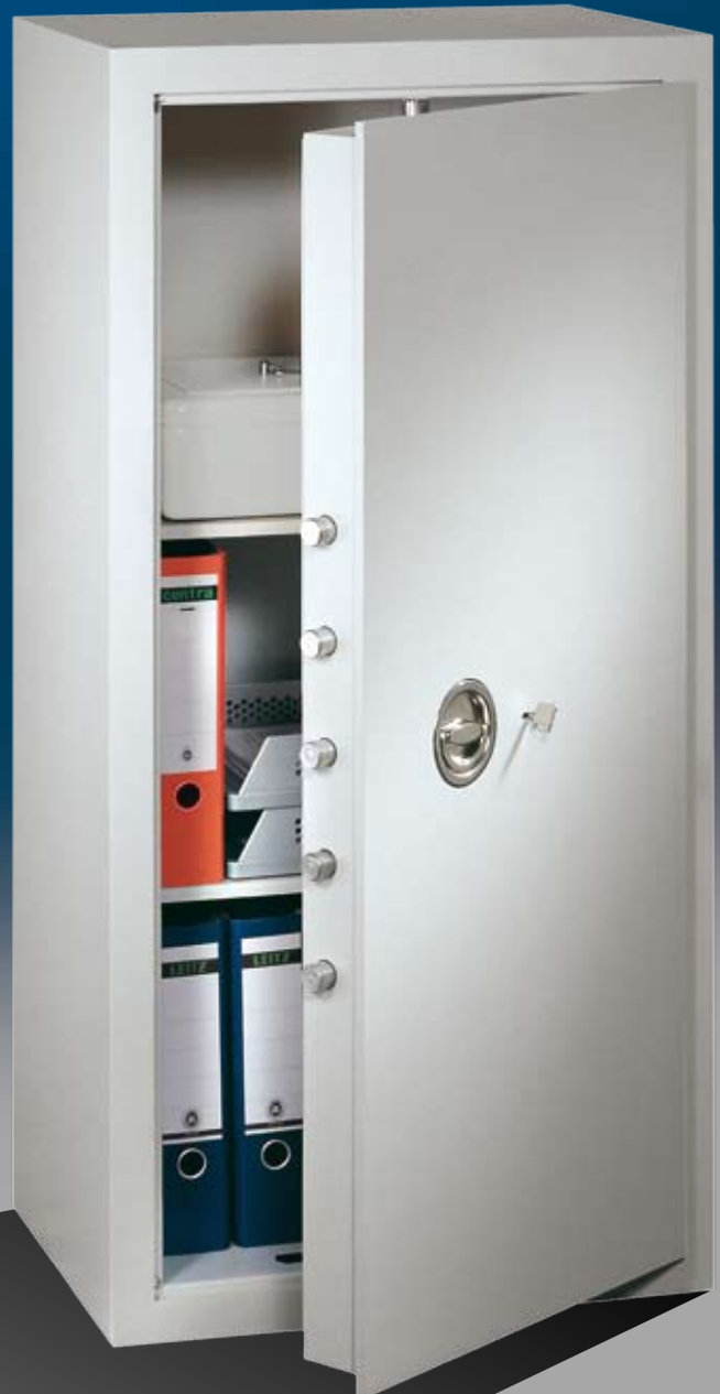
Abb.: MNO 12