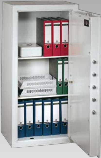
Abb.: MNO 12