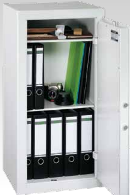
Abb.: PT 9