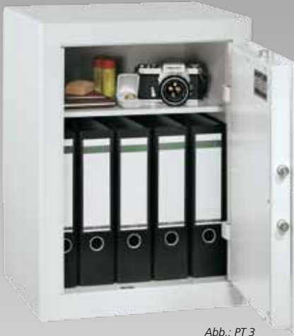
Abb.: PT 3