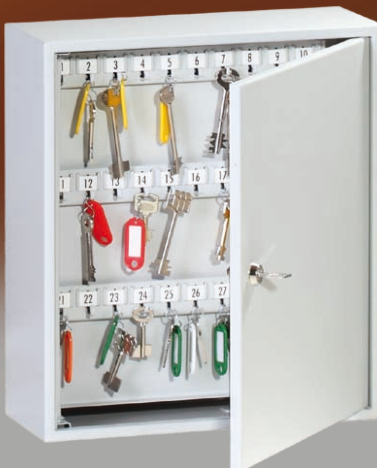
Abb.: K 100

Ummantlung ohne Angriffspunkte; Schlüsselleiste verstellbar, mit stabilen Metallhaken