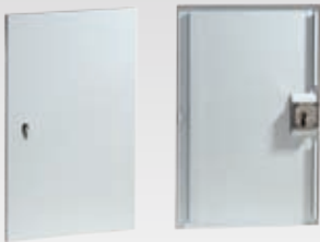
Abb.: Tür mit Vorrichtung für Profilhalbzylinder