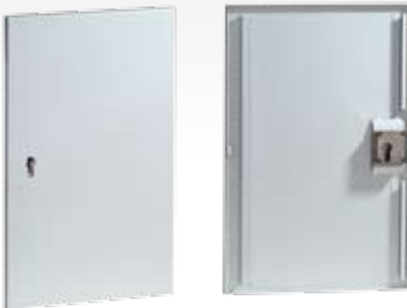
Abb.: Tür mit Vorrichtung für Profilhalbzylinder