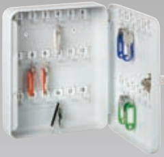
Abb.: RL 30