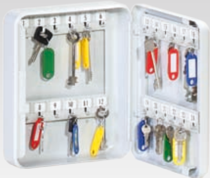
Abb.: RS 24