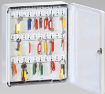
Abb.: RS 100

Es entstehen dadurch keine Mehrkosten für die Kassette.