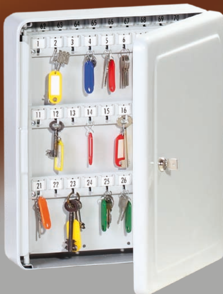
Abb.: RS 100

Schlüsselleiste verstellbar; mit stabilen Metallhaken