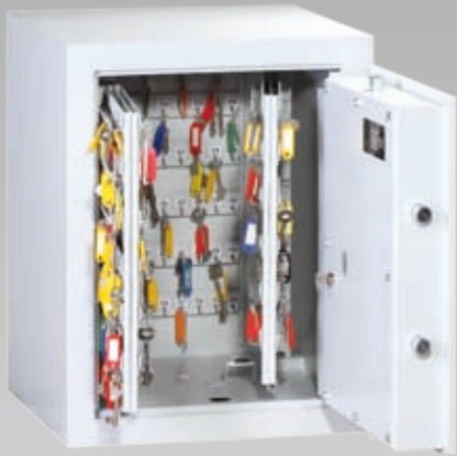
Abb.: MST 1-300