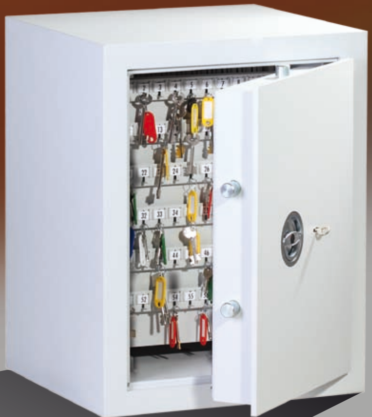
Abb.: MST 1-300