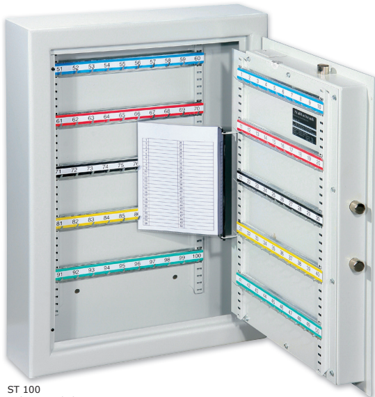
ST 100 Lichtgrau • light grey